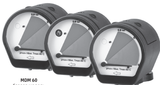
MDM 60 базова модель